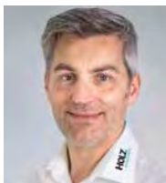
HOLZ automation GmbH

Neue Lösungen für unsere Produkte austüfteln.