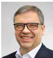
Keller Lufttechnik GmbH + Co. KG

Abteilungsleiterin Controlling, Kaufmännische Projektentwicklung